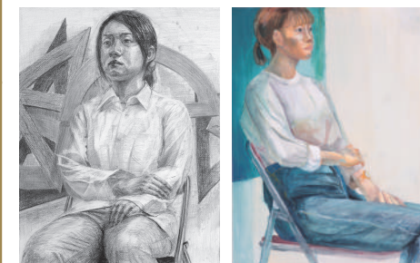
人物(左:鉛筆デッサン,右:水彩)