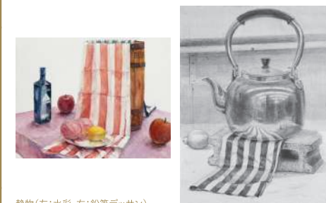
静物(左:水彩,右:鉛筆デッサン)