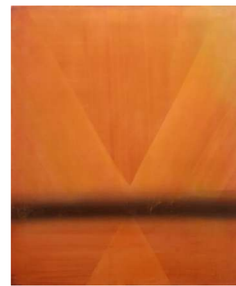
屋間部在籍者作品