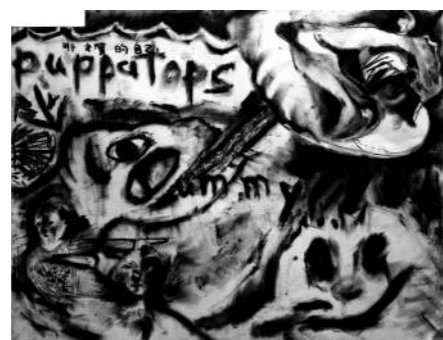
東京芸術大学合格者作品