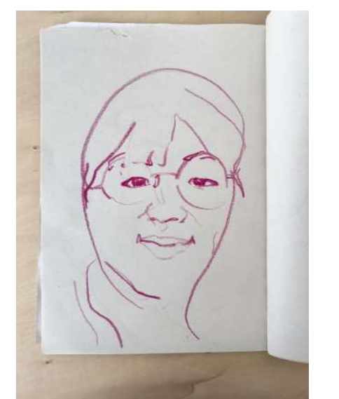
東京芸術大学合格者作品 ドローイング