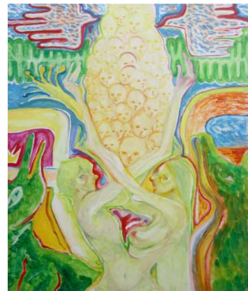
東京芸術大学合格者作品