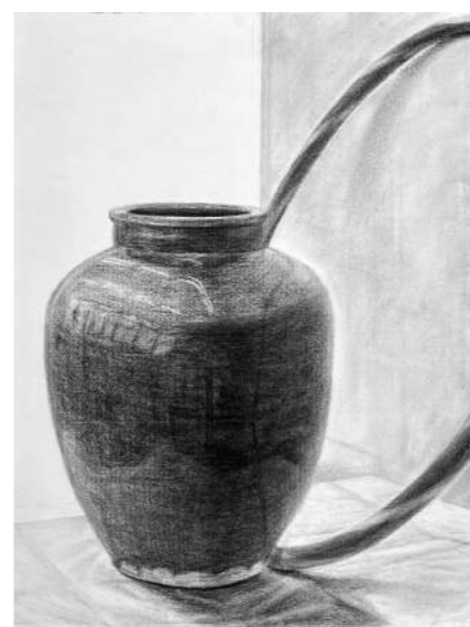
現 埼玉大学合格者作品