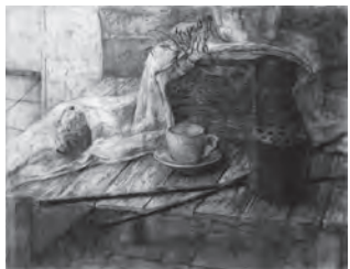
静物デッサン(木炭)