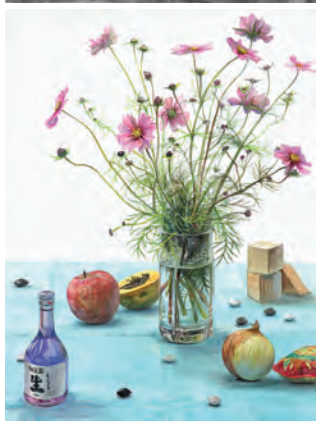
静物着彩(透明水彩)