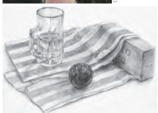
鉛筆デッサン(白上構図)