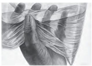
構成デッサン(鉛筆)